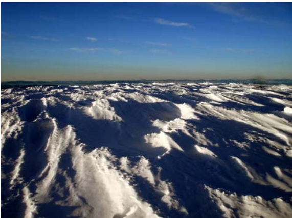
K. Hacet zirve

Saat 16.00'de zirveye ulaşıyoruz. Hava açık ve görüş mesafesi uzun. Büyük Hacet zirve ve Ilgaz kayak tesislerinin olduğu dağlar da dâhil her yer göz alabildiğine görünüyor. Geçen çıkışımızda sis yüzünden hiç bir yer görünmüyordu, sis ve yerdeki kardan dolayı yer-gök hep aynı renkтейdi. O atmosfer hepimiz için farklı bir tecrübeydi.