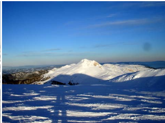
K. Hacet zirveden Büyük Hacet