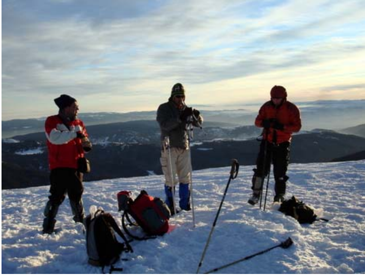
Küçük Hacet zirve

Zirvede, hareketsiz olduğumuzdan ve cılızlaşan güneş ışığından olsa gerek havanın soğukluğunu daha çok hissediyoruz. Fazla oyalanmadan gün batımı ile birlikte saat 16.25’de zirveden iniyoruz. Bayağı geciktik. Derin kar yürüyüşümüzü oldukça yavaşlattı.