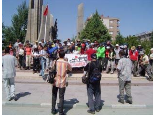
Ereğli anıtındaki tören