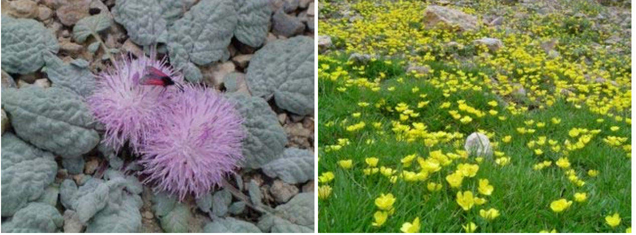
Aksu vadisindeki çiçekler

Delimahmutlu (Zindan Deresi-Aydinkent çayı) Vadisini takip ederek orman içindeki patikadan Kızılkuz'daki Aksu Şelalesi'ne ulaştık. Burada, zorlu rampa öncesi mola verip yaylacılarla sohbet ettik. Burda konaklayan yaylacıların Tarsus'un köylerinden buraya geldiklerini öğrenince çok şaşırdım.