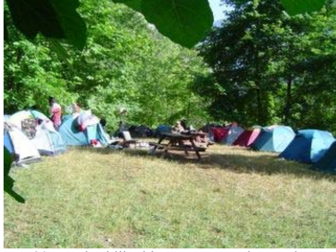
780 m yükseklikteki Papazın Bağı kamp alanı

Bu kamp yeri oldukça modern sayılır. Temiz tuvaletler ve çeşme var. Ayrıca bir de alabalık çiftliği. Yemeklerimizi yedikten sonra çadırlarımıza çekildik. Yarın da burda kalmaya karar verdik.