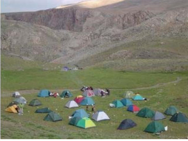
Gögeri'deki kamp yerimiz

olduğu ilk toplu fotoğrafı burda alabildik. Ayrıca katılımcı iller ayrı ayrı fotoğraf çekti. Ancak Mersin grubu her ilin fotoğrafına, kahkaha tufanı eşliğinde, ayrı ayrı girmeyi başardı.