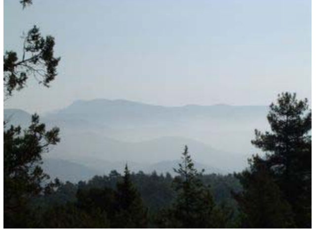
Sığır yaylasından Bolkarlar

Bir süre yürüdüktan sonra Saat 09:30 da Sinap kalesine ulaştık. Yürüyüşü sonlandıracağımız Çamlıyayla gözükmeye başladı. Bir süre kalenin yanında dinlendikten sonra saat 09:45’de Çamlıyayla’ya gitmek için ayrıldık.