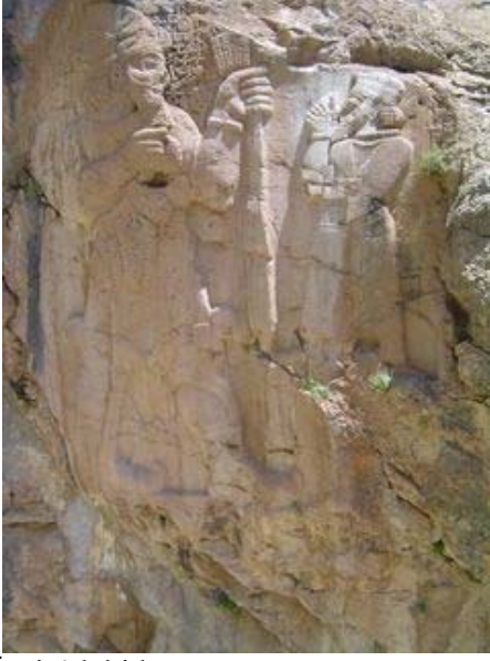
İvriz'deki kaya anıtı