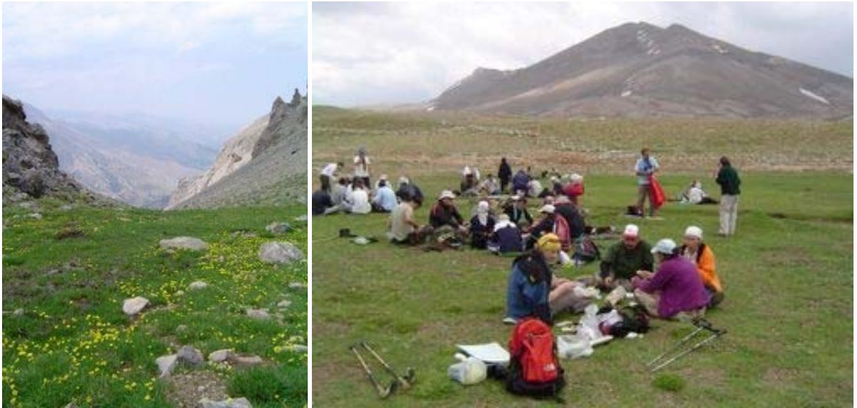
Aksu vadisinin sırttan görünüşü

Zorlu ve yorucu bir tırmanıştan sonra 12:15'de vadi sırtına ulaştık. Saat 12:30'da Tersakan'daki Şekerpınarı'na vardık. Öğlen yemeği için mola verdiğimiz bu yayla oldukça geniş ve burdan çıkan soğuk su ticari olarak satılan Hayat Su'nun kaynağı. Burası aynı zamanda üç il sınırının, Niğde, Mersin ve Konya'nın kesiştiği yer.