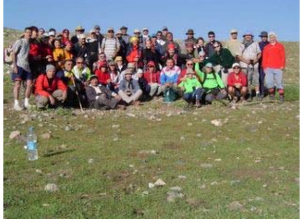
Katılımcılar Gögeri kamp yerinde bir arada

Saat 07:25'de yola koyulduk. Kamp yerinin yakınındaki göl kenarından geçerek boğaz içinden yürüyüşümüzü sürdürdük. Yürüyüş rotasının en bakir kısmı burası, bu kısımda taşıt yolu yok, patika boyunca yürüyoruz. Yol boyu çobanlarla ve sürülerle karşılaşıyoruz. Artçımız Bahadır bey, (çiçek toplamak maksadıyla) arkada kalanları toplayarak geliyor.