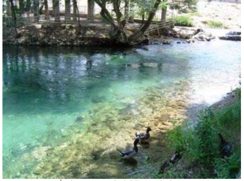
İvriz çayı üzerindeki su göleti

Saat 13:00'de Deli Mahmutlu'ya gitmek üzere İvriz'den ayrıldık. Saat 13:09'da Halkapınar, Büyük Doğan köyü, 13:25 Köser köyü, 13:41 Osman Köseli köyüne, 13:50'de de Delimahmutlu'ya ulaştık. Sırt çantalarımızı traktöre yükledikten sonra 14:00'da Deli Mahmutlu'dan kamp kuracağımız Arap Çukuru'na kadar yürüdük. Saat 15:40'da Arapçukuru'na ulaştık. Aydos'un (3480 m) alt ucunda olan bu kamp yerinin rakımı 1500 m. Çadırlarımızı kurduktan sonra biraz istirahat ettik. Saat 17:30'da Delimahmutlu çayının kaynağına doğru yaklaşık bir saatlik bir yürüyüş yaptık.