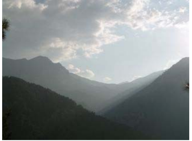
Tanzit yaylasından Kadıncık vadisi

Biz de 26 kişi olarak Saat 16:30 Tanzi’tan ayrıldık. Kestirme yollar kullanarak koşar adımlarla orman içinden inişe geçtik. Saat 18:50’de Kadıncık dere yatağına ulaştık. Kadıncık deresine koşut uzanan 5 km’lik araç yolu boyunca yürüyerek saat 19:50 gibi geceyi geçireceğimiz 780 m rakımlı Papazın Bağı’na vardık. Uzun günün yorgunluğunu atmak için havlusunu alan kamp alanının yakınındaki soğuk suyun altına girdi.