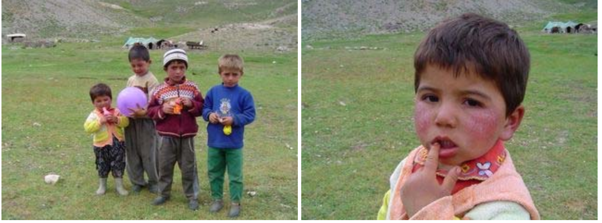
Gögeri yaylasındaki yayla çocukları

Saat 15:45'de Hacı Recep yaylasından geçerek geceyi geçireceğimiz Gögeri yaylasına yöneldik. Yürüyüş boyunca karşılaştığımız yaylacılarla kısa sohbetler ettik. Yanlarında ilaç ve çocuklar için küçük hediyeler getiren düşünceli katılımcılar bunları köylülerle paylaştılar, çocukları sevindirdiler.