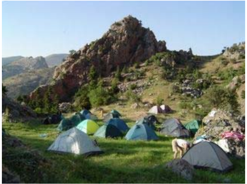
1. kamp yerimiz, Arapçukuru (1500 m)

Akşam yemeğini yedikten ve çaylarımızı yudumladıktan sonra kamp alanında toplanarak yürüyüşe katılanlarla tanıştık. Ankara, Adana, Bursa, Konya, Denizli, Ereğli, Mersin, Muğla, İzmit ve